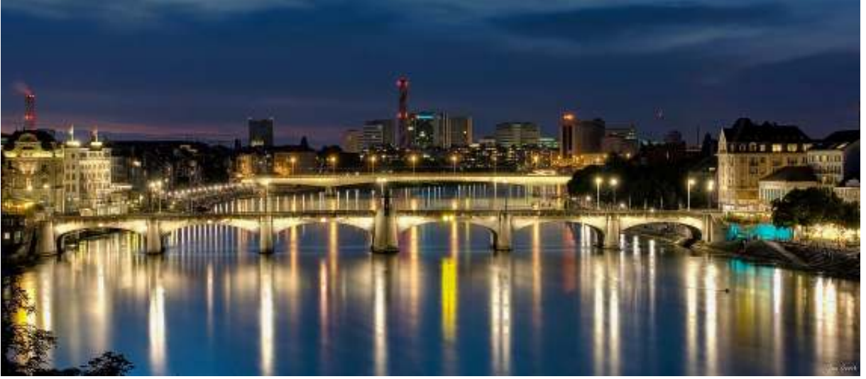
फोटो: बासेर शहरको एक दृष्य

बासेल एक ऐतिहासिक एवं साँस्कृतिक महानगरी हो। यहाँ सर्वप्रथम मानविय बसाई आजभन्दा १३०००० बर्ष पहिला भएको मानिन्छ। बासेल शहर स्विटजरल्याण्डको साँस्कृतिक राजधानीका रूपमा चिनिन्छ। यहाँको अर्थतन्त्र स्विटजरल्याण्डकै सबैभन्दा गतिशील अर्थतन्त्र मानिन्छ। जर्मनी, फ्रान्स र स्विटजरल्याण्डको त्रिदेशिय सिमामा पर्ने बासेल शहर आकर्षक राईन नदिको किनारमा अवस्थित छ। बासेल स्विटजरल्याण्डको सबैभन्दा सानो, तर सबैभन्दा बढि जनघनत्व भएको कान्टोन हो। स्थानिय बासिन्दाहरु बासेल शिक्षा, प्रविधि, विज्ञान र खेलकुद आदिमा उत्कृष्टता उत्पादन गर्ने क्षेत्र भएकोमा गर्व गर्दछन्। बिसौं शताब्दिमा चारजना नोबल पुरस्कार विजेताहरु बासेलमा बसोबास गर्दथे। विश्वप्रख्यात टेनिस खेलाडी रोजर फेडेरर बासलकै हुन्। कार्यक्रमको समापन पश्चात ईच्छुक सहभागीहरुका लागि १६ मार्च २०१६ मा “बासेल सिटी टुर” को ब्यबस्था गरिएको हामी सहर्ष जानकारी गराउँदछौं।