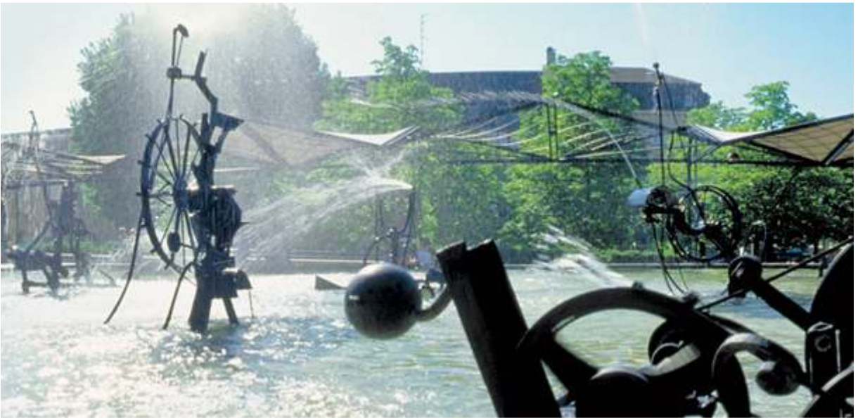
फोटो: बासेलको पानी पार्क