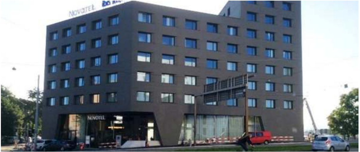
होटल ठेगाना: Ibis Budget Basel-City, Grosspeterstrasse 12, 4052 Basel

तीन बेड भएको कोठामा सुत्नका लागि प्रति ब्यक्ति प्रति रात ३२ स्विस फ्रयाडकस् (लगभग २९.५० यूरो) लाग्ने छ। यसैभित्रबाट हरेकले सिटि क्षेत्रका सार्वजनिक यातायात निशुल्क प्रयोग गर्न पाउने गरी एक सिटि टिकट प्राप्त गर्ने छन्। बिहानको नास्ता गर्न चाहनेले प्रति ब्यक्ति ११ स्विस फ्रयाडकस् तिरी होटलमा अवस्थित रेष्टुरेन्टको सुबिधा लिन सक्नेछन्।